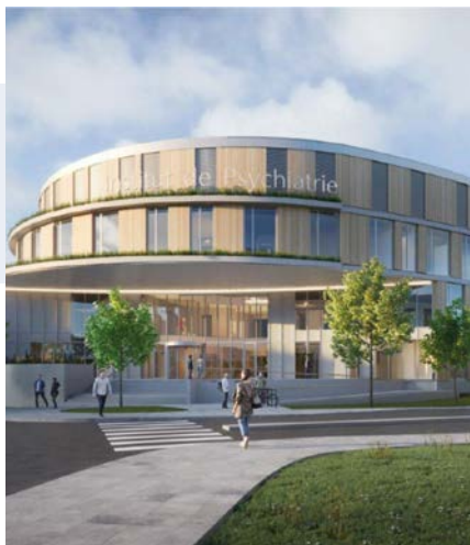
Valisana - site I.P.I, Psychiatrisch ziekenhuis