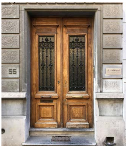
Valisana - site Het Canevas, Psychotherapeutisch dagcentrum